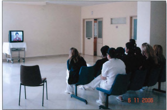
Στο χωλ του 4ου ορόφου του Μαιευτηρίου "ΜΑΡΙΚΑ ΗΛΙΑΔΗ" Μαίες, Σπουδάστριες του Τμήματος Μαιευτικής των Τ.Ε.Ι. Αθηνών, μέλλουσες μητέρες, λεχιδες και οι συγγενείς τους παρακολουθούν ταινίες σχετικές με το Μητρικό Θηλασμό.