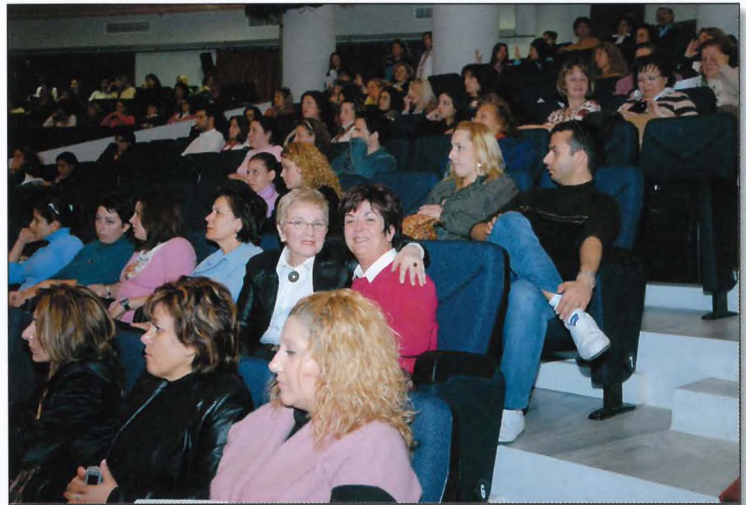
Μαίες και Μαιευτές απ' όλη την Ελλάδα παρακολουθούν με μεγάλη προσοχή ένα από τα πιο ενδιαφέροντα θέματα του Συνεδρίου μας.