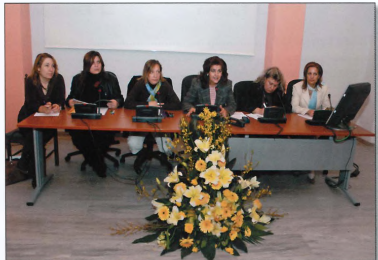
Στο κλείσιμο των εργασιών του Συνεδρίου οι Πρόεδροι των Σ.Ε.Μ. αναφέρθηκαν στους στόχους και τις προοπτικές του κλάδου μας.