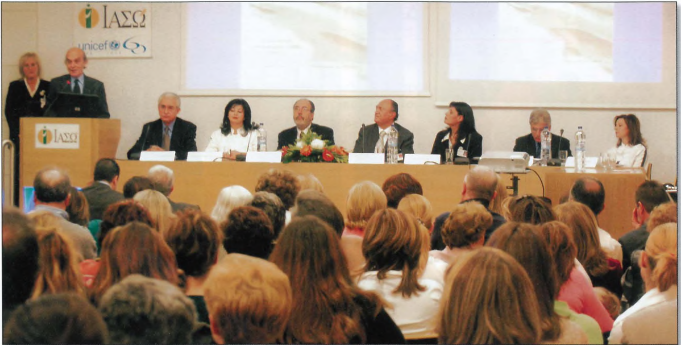
Μέλη της Οργανωτικής Επιτροπής της Ημερίδας Μητρικού Θηλασμού στο Μαιευτήριο "ΙΑΣΩ" και πολυάριθμο ακροατήριο παρακολουθούν με προσοχή την ομιλία του Προέδρου της UNICEF κ. Κανελλόπουλου, ο οποίος τόνισε ιδιαίτερα τη σημαντικότητα της δημιουργίας των "Baby Friendly Hospitals" και στην Ελλάδα.