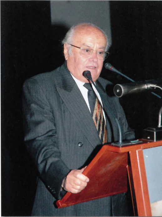
Ο Καθ. Μαιευτικής-Γυναικολογίας κ. Νικόλ. Παπανικολάου χαιρετίζει το "αγαπημένο" του ακροατήριο. Ήταν βραδιά τιμής για τον Άνθρωπο, τον Επιστήμονα, το Δάσκαλο και Συμπαρασάτη μας.