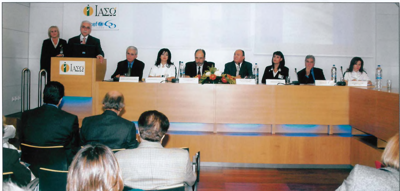
Ο Υφυπουργός του Υ.Υ.Κ.Α. κ. Γιαννόπουλος χαιρετίζει την Ημερίδα του Μητρικού Θηλασμού στο Μαιευτήριο "ΙΑΣΩ".