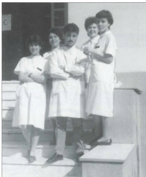
Σπουδαστές του Τ.Ε.Ι. Μαιευτικής Αθήνας, κατά τη διάρκεια της πρακτικής εκπαίδευσής τους.

Οι έξι μήνες παρακολούθησης του προγράμματος, με τους 40 υποχρεωτικούς τοκετούς, δίνει στην ασκούμενη σπουδάστρια Μαία, την απαραίτητη γνώση και αυτοπεποίθηση που χρειά-