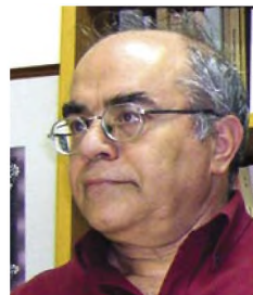
του Στ. Φραγκόπουλου*

Ο φιλόσοφος Επίκουρος που γεννήθηκε στη Σάμο, γιος του Αθηναίου Νεοκλή, ήταν ιδρυτής της Σχολής των Επικουρείων στην Αθήνα. Σε ηλικία 14 ετών άκουσε μαθήματα από τον πλατωνιστή Πάμφιλο. Για τη φιλοσοφική του εξέλιξη έπαιξε ρόλο η σπουδή του (327-324) με δάσκαλο τον Ναυσιφάνη, ο οποίος του δίδαξε την Ατομιστική του Δημόκριτου και τη θεωρία της ηδονής της Κυρηναϊκής Σχολής. Αργότερα ο ίδιος έλεγε ότι όλα όσα ήξερε τα έμαθε μόνος του, γιατί οι δάσκαλοι δεν μπορούσαν να του εξηγήσουν, τί υπήρχε πριν από το χάος, από το οποίο προέκυψε η ζωή.