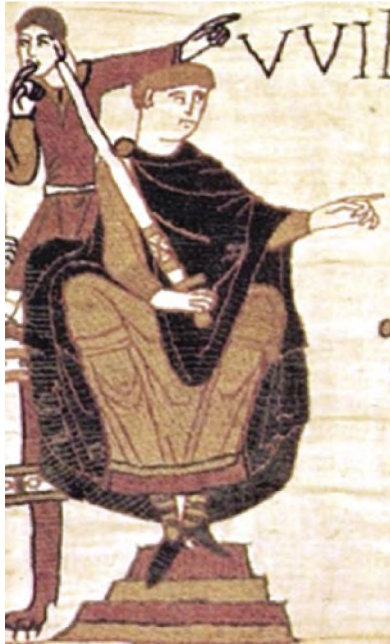
Ο Γουλιέλμος ο Κατακτητής σε απεικόνισή του στην Tapisserie του Bayeux

είναι πιο εκτεταμένο από το Great, δεδομένου ότι περιλαμβάνει πολλές απογραφικές λεπτομέρειες για τις περιοχές που ερευνά, οι οποίες φθάνουν μέχρι την καταγραφή των ζώων κάθε ιδιοκτησίας.