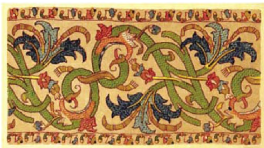
Ύφασμα από μετάξι. Βενετία, 1520

η βιοτεχνία ύφανσης μεταξωτών, την εποχή στην οποία αναφερόμαστε, ήταν η Φλωρεντία, η Γένοβα, η Βενετία.