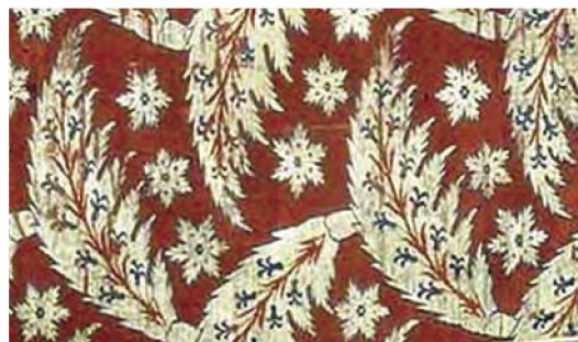
Ύφασμα μπροκάρ από μετάξι. Τουρκία, 16ος αιώνας

Τα υφάσματα στην Ευρώπη του 16ου αιώνα από λινό, βαμβάκι, μαλλί και μετάξι κατασκευάζονταν στην Αγγλία, Γαλλία και Βόρεια Ιταλία σε μεγάλη κλίμακα. Η ύφανση ήταν προηγμένης τεχνικής, γεγονός που σε συνδυασμό με τα έξοχου λεπτότητας και υψηλής ποιότητας νήματα, έδινε προϊόντα που δεν κάλυπταν μόνο