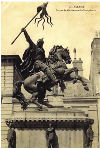
Το άγαλμα του Γουλιέλμου του Κατακτητή στη γενέτειρά του πόλη Falaise (Γαλλία)

Οι ιδιοκτήτες γης εκαλούντο να δηλώσουν ενόρκως στην έδρα κάθε κομητείας ή σε άλλα διοικητικά κέντρα (hundreds και wapentakes) κάθε λεπτομέρεια σχετικά με την ιδιοκτησία των και, γενικότερα, με τα περιουσιακά τους στοιχεία αλλά και τις μεταβολές που αυτά είχαν υποστεί από την εποχή της βασιλείας του Εδουάρδου του εξομολογητή.