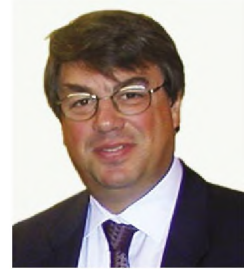
του Ι. Χάλαρη*

Υπάρχει άραγε ρεαλιστικό όραμα για τα ΤΕΙ;