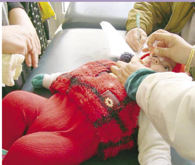
εμβολιασμός (SABIN) κατά της πολιομυελίτιδας