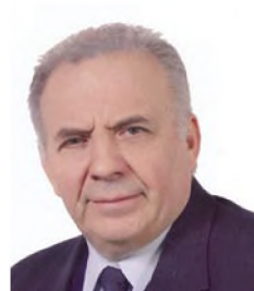
του Χ. Φράγκου*