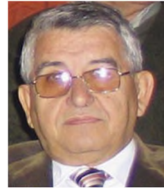
του Ι. Κάτανου*

του νόμου 3549/2007 για την εφαρμογή του στα ΤΕΙ