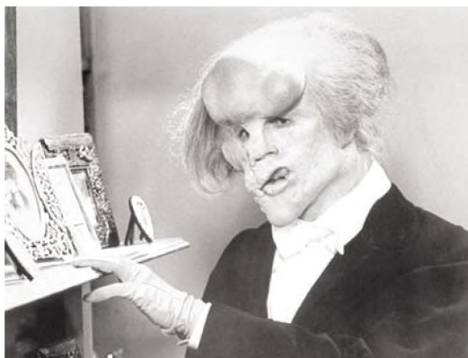
Ο John Hurt ως John Merrick στην ταινία "The Elephant Man" του David Lynch.

Τότε ο Πρωτέας γινόταν φίδι, δράκος, χύμα, φωτιά, νερό, τίγρης, ή οτιδήποτε άλλο επέλεγε.