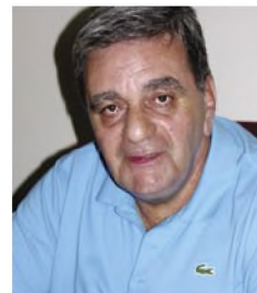
του Α. Καμμά*

Ο Πρωτέας ήταν ένας μικρός θαλάσσιος θεός, γιος του Ποσειδώνα και της Φοινίκης, αν και ο Όμηρος έχει άλλη άποψη όταν, στα έπη του, τον παρουσιάζει γέροντα τον οποίον αποκαλεί «Άγιο».