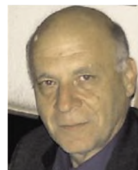
του Δ. Α. Τριάντη*

Μια επιπλέον πρόκληση για την αναβάθμιση της εκπαιδευτικής διαδικασίας στο Ίδρυμά μας