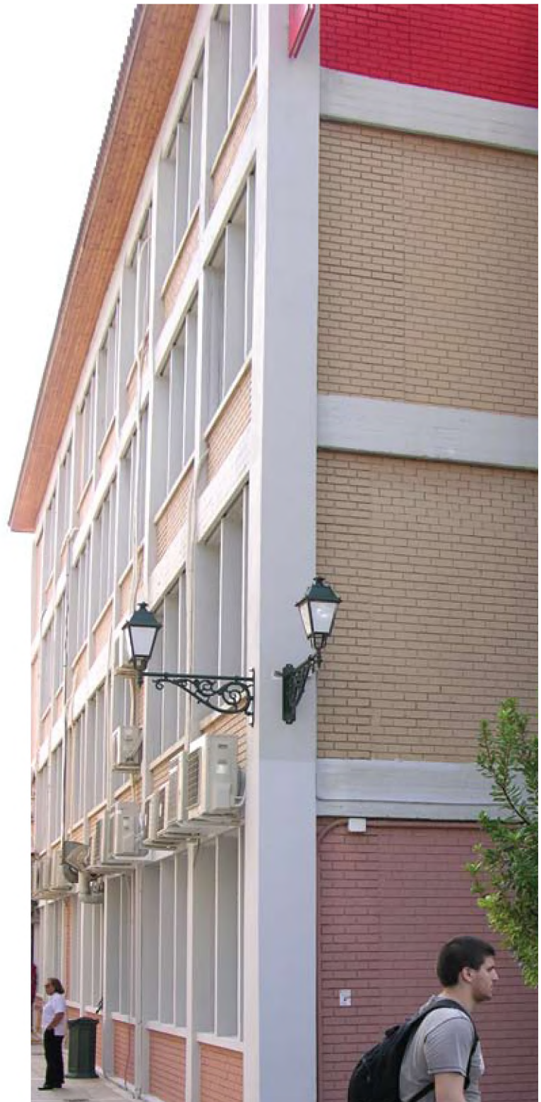
Τεχνολογικό Εκπαιδευτικό Ίδρυμα Αθήνας