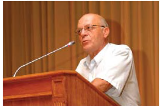
Ο Διευθυντής της Σχολής στην εναρκτήρια ομιλία συγχαίρει τους τελειόφοιτους που έλαβαν μέρος στο διαγωνισμό

Με βάση τα παραπάνω κριτήρια απονεμήθηκαν 3 ισότιμα βραβεία και 3 ισότιμοι επαίνοι , ως εξής: