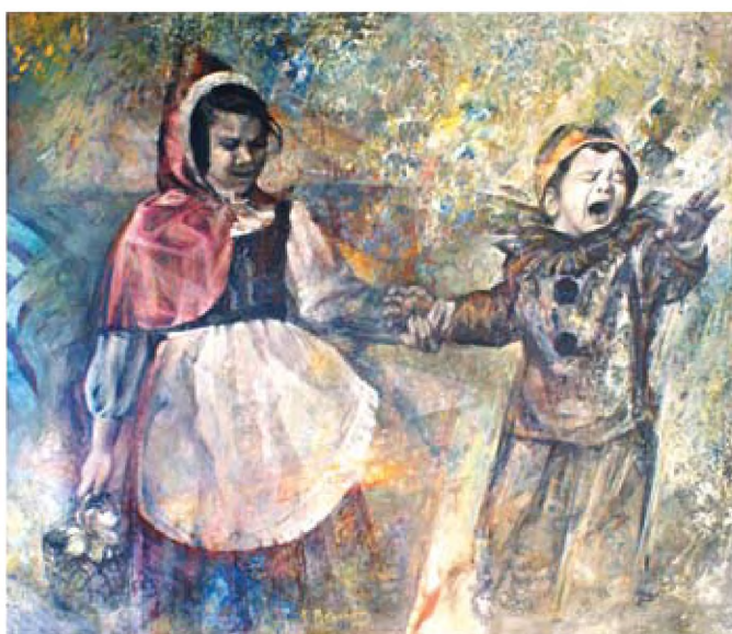
Παιδικό πείσμα, 160 x 180 cm