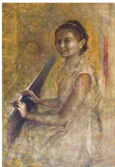
Ταξίδι με τις μελωδίες, 70 x 100 cm

Με επιτυχία πραγματοποιήθηκε η έκθεση ζωγραφικής της Άννας Μπενάκη, αναπληρώτριας καθηγήτριας στο τμήμα Γραφιστικής, με τίτλο «Ταξίδι στα συναισθήματα», στον εκθεσιακό χώρο της Ζωσιμαίας Παιδαγωγικής Ακαδημίας στα Ιωάννινα, από 12 Απριλίου έως 7 Μαΐου 2010. Την έκθεση προλόγισαν οι: Γιώργος Χαρβαλιάς , Πρύτανης της Ανωτάτης Σχολής Καλών Τεχνών Αθήνας και ο Θάνος Χρήστου , αναπληρωτής καθηγητής Ιστορίας της Τέχνης του Πανεπιστημίου Ιωαννίνων.