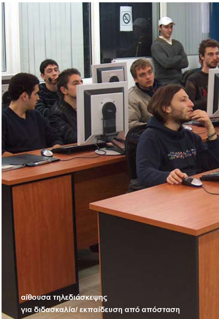
αίθουσα τηλεδιάσκεψης για διδασκαλία/ εκπαίδευση από απόσταση