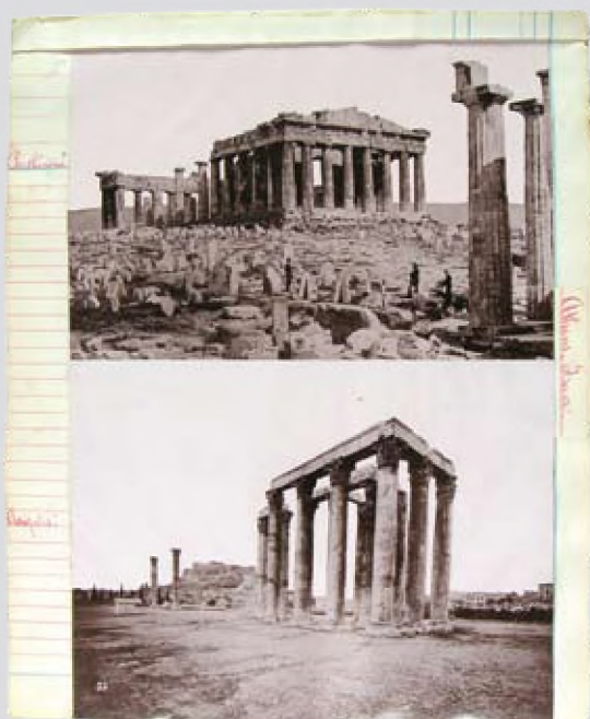
πριν την αποκόλληση