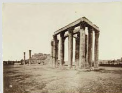
μετά την αποκόλληση