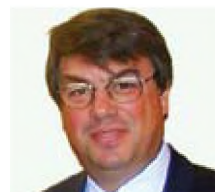
του Ι. Χάλαρη*

ενημερωμένη βάση, ιδιαίτερα χρήσιμη τόσο για την επικοινωνία με τους επιστημονικούς και εργαστηριακούς συνεργάτες όσο και για τις μελλοντικές αξιολογήσεις.