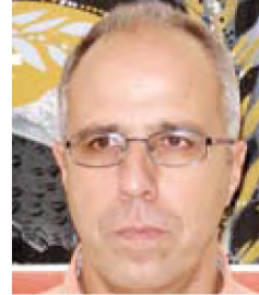
του Ν. Μ. Χιωτίνη*

Σ τις μέρες μας, ολοένα και περισσότερο, διαπιστώνουμε το πόσο αυθαίρετες κατασκευές και νοηματοδοτήσεις λέξεων και όρων, μας οδηγούν σε απόλυτες συγχύσεις εννοιών και πρακτικών . Δεν μπορούμε βεβαίως εδώ παρά να ανατρέξουμε στην μνημειώδη ρήση του κυνικού Αντισθένης , πως « αρχή παιδείας η των ονομάτων επίσκεψις ». Δύο λέξεις που μας έχουν τελευταία αποπροσανατολίσει είναι οι λέξεις πολιτισμός και πολιτική.