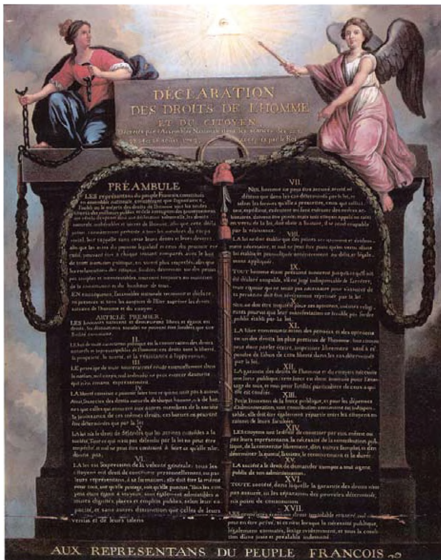
Διακήρυξη των δικαιωμάτων του ανθρώπου και του πολίτη (Αύγουστος 1789) | Musée Carnavalet, Παρίσι

των μελών της κοινωνίας. Σημειωτέον μάλιστα ότι ο όρος culture προέρχεται από το culte , που έχει να κάνει και με έννοιες θρησκευτικές, εξ' άλλου και ο όρος καλλιέργεια ετυμολογικώς δεν ταυτίζεται αποκλειστικά με την καλλιέργεια της γης, αλλά εμπεριέχει τη λέξη κάλλος και τη λέξη έργον . Υπάρχει και η λέξη καλλιέργεια , επίσης με το συνθετικό κάλλος και το ιερόν, με βαθύτερη βεβαίως σημασία. Εν πάση περιπτώσει σήμερα με έναν αυθαιρέτως νοηματοδοτημένο «πολιτισμό»