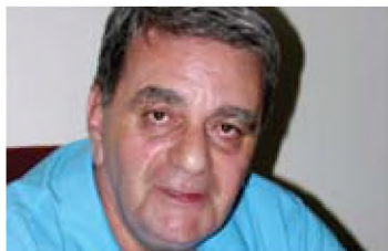
του Α. Καμμά*

Αναφέρομαι στη σελίδα των castrati , αυτών