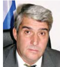
του Π. Λύτρα*

μία νεωτεριστική προσέγγιση της τμηματοποίησης της τουριστικής αγοράς