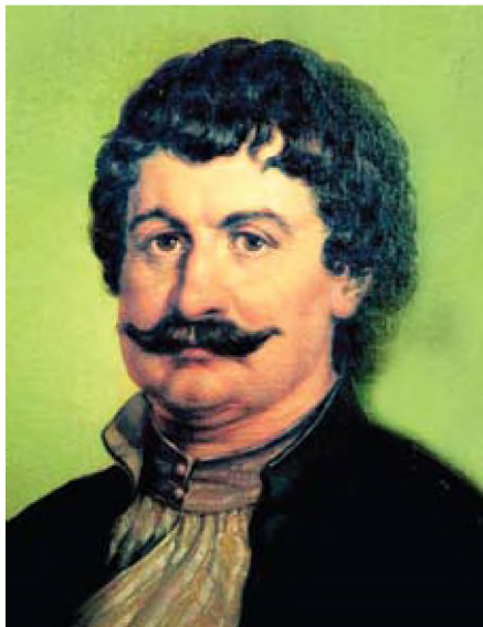
Ρήγας Φεραίος (1757 -1798)

Η Ιδέα του Νέου Ελληνικού Κράτους προέκυψε από μία εκπληκτική σύζευξη νεωτερικότητας και Ελληνικής Παράδοσης όπως αυτή σχηματοποιήθηκε σε πολιτική πράξη από το Ρήγα . Η Ευρώπη ήδη από τα τέλη του 18 ου και κυρίως σ' όλο τον 19 ο αιώνα - και ακόμα περισσότερο στον 20 ο - βιώνει τα αδιέξοδα της νεωτερικής νοηματοδότησης του Ανθρώπου και του νοήματος της Ζωής. Από τότε μέχρι τις μέρες μας, βιώνει το σταδιακό θάνατο της ψυχής και της ελευθερίας, τις συνέπειες δηλ. της κυριαρχίας του λεγόμενου «ορθολογισμού», που κατέπεσε σε καθαρά εργαλειακό ορθολογισμό στην υπηρεσία του παραγωγισμού και της κατανάλωσης, που κυριάρχησαν ως τα νέα δόγματα που είναι τα μόνα που εκφράζουν την έννοια της προόδου και της ευτυχίας. Ως αντιστάθμισμα λοιπόν αυτής της επικρατούσης κατά τον 18 ο αιώνα δυτικής νεωτερικής νοοτροπίας, δηλ. δυτικής πολιτισμικής πρότασης, ως αντιστάθμισμα «της πρώτης απογοήτευσης του κόσμου», όπως ονόμαζε ο Καστοριάδης την απογοήτευση