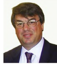
του Ι. Χάλαρη*