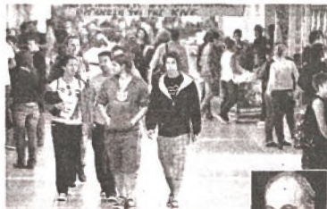
«Τα ΤΕΙ ή θα πρέπει να γίνουν κανονικές πολιτικές σχολές ή θα πρέπει να επανέλθουν στη λογική παραγωγής ουσιαστικών στελεχών εφαρμογής ή θα πρέπει να κλείσουν», είναι οι επιλογές που θέλει ο πρόεδρος του ΤΕΕ κ. Αθανάσιος, παραδοτώντας τη χρόνια αντιπαράθεση.

Δεν μπορούν, σε καμία περίπτωση, να προσδιοριστούν επαγγελματικά δικαιώματα που σκετιζονται άμεσα με την απόφαση των κατασκευών και των παρεχόμενων υπηρεσιών, με βάση τις σπουδές σε ΤΕΙ που δεν υπάρχουν παρά μόνο στα χαρτιά και αυτά να δοθούν σε όσους όσοι έχουν αποφοιτήσει από ΤΕΙ ανώτερης εκπαίδευσης, από ΚΑΤΕΕ, από μέσες σχολές που έ-