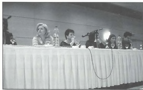
Το Δ.Σ. του Σ.Ε.Μ.Α. έτοιμο για τη Συνέλευση.