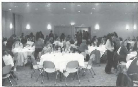
Η αίθουσα του ξενοδοχείου πριν την έναρξη.