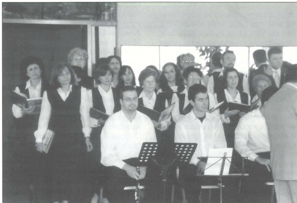
Από την εκδήλωση για την Παγκόσμια Ημέρα της Μαΐας και της Μητέρας, στην οποία έπαιξε και τραγούδησε το καλλιτεχνικό σχήμα "Θεματοφύλακες της Παράδοσης".

ποίκιλων εκδηλώσεων και συναισθηματικών μεταπλάσεων της Μαρμής, της γιαγιάς και της μικρομάνας, για την ψυχοσωματική ανάπτυξη του βρέφους. Ο συναισθηματικός δεσμός των τριών αυτών γυναικών (Μοιρών), είχε σαν απαύγασμα τις μελλοντικές προσδοκίες ευτυχίας του παιδιού στον κόσμο.