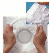
Pampers Extra Unisex

Χρησιμοποιώντας ένα γυάλινο μπουλ, δείτε τι συμβαίνει αν ασκήσετε πίεση (ανάλογη με το βάρος ενός μωρού) σε μια πάνα. Με άλλες πάνες, τα ούρα επιστρέφουν στην επιφάνεια. Με τα Pampers Baby Dry Extra Unisex η υγρασία δεν επιστρέφει σχεδόν καθόλου.