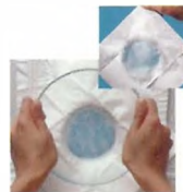
Ειγόμενη καλύτερη πάνα

Και φυσικά τα Pampers έχουν επανακαλλούμενες ταινίες που κολλούν κάθε φορά σίγουρα, ακόμα κι αν έρθουν σε επαφή με κρέμες ή λουσόν, κάνοντας τις αλλαγές πιο ευχάριστες τόσο για σας όσο και για το μωρό σας.