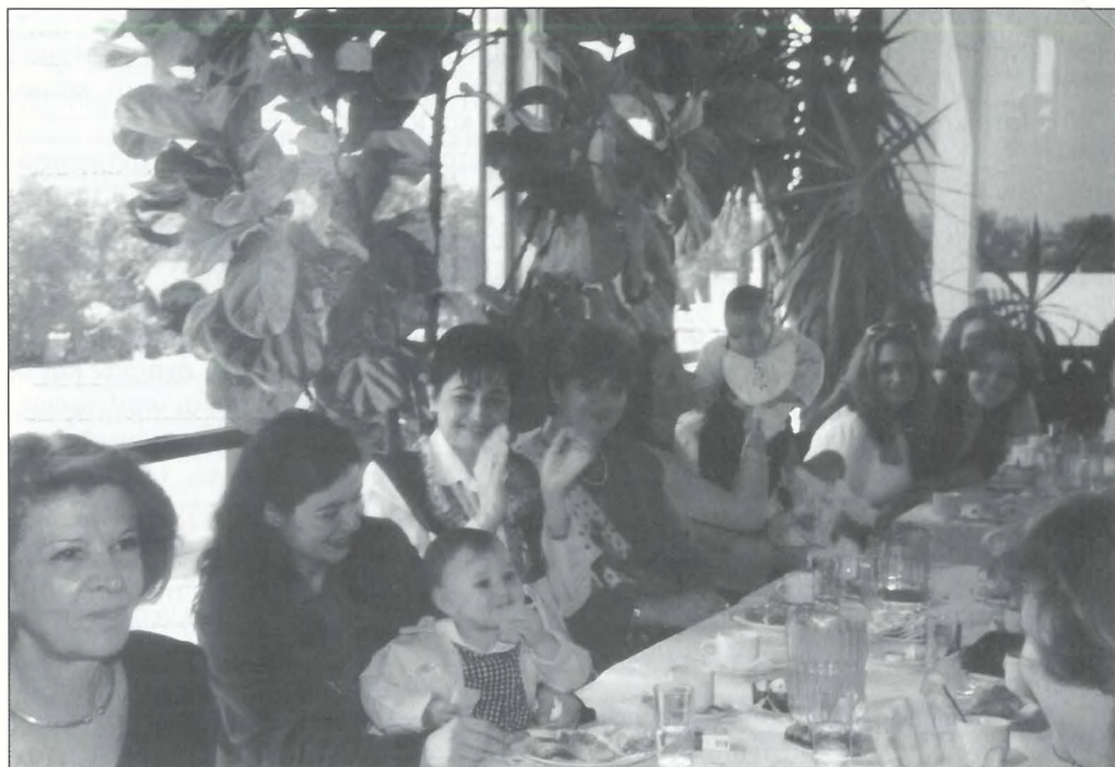
Φωτογραφία από την εκδήλωση για την Παγκόσμια Ημέρα της Μαίας (5 Μαΐου) και της Μητέρας (9 Μαΐου) στο Ξενοδοχείο "PRESIDENT", την 9η Μαΐου 1999.