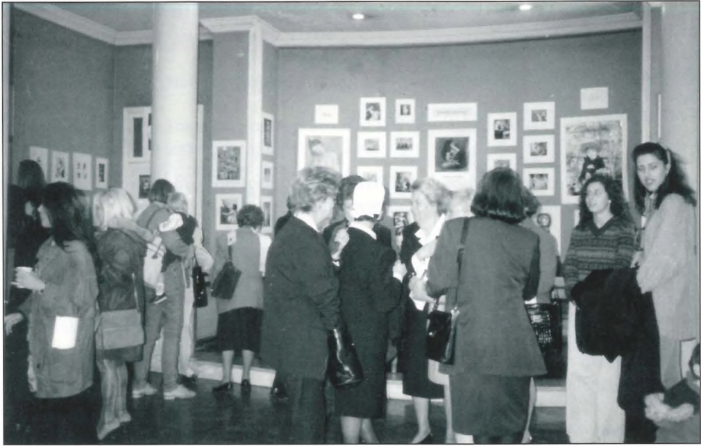
Φωτογραφία από τις εκδηλώσεις στο χώρο της έκθεσης, που είχε ως θέμα τη «Μητρότητα ανά τους αιώνες και τους λαούς».

γέννησαν στο Μαιευτήριο (ώρα 11.00 - 11.30).