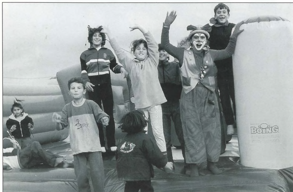
Τα παιδιά του καταυλισμού χαίρονται με τα παιχνίδια, την παράσταση του κλόουν και το τρομπολίνο.