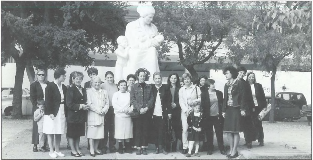
Στα πλαίσια των εκδηλώσεων της Παγκόσμιας Εβδομάδας Μητρικού Θηλασμού, ομάδα μαιών και γιατρών τιμούν με στεφάνι το άγαλμα της "Θηλάζουσας Μητέρας" στην πλατεία Έλ. Βενιζέλου.