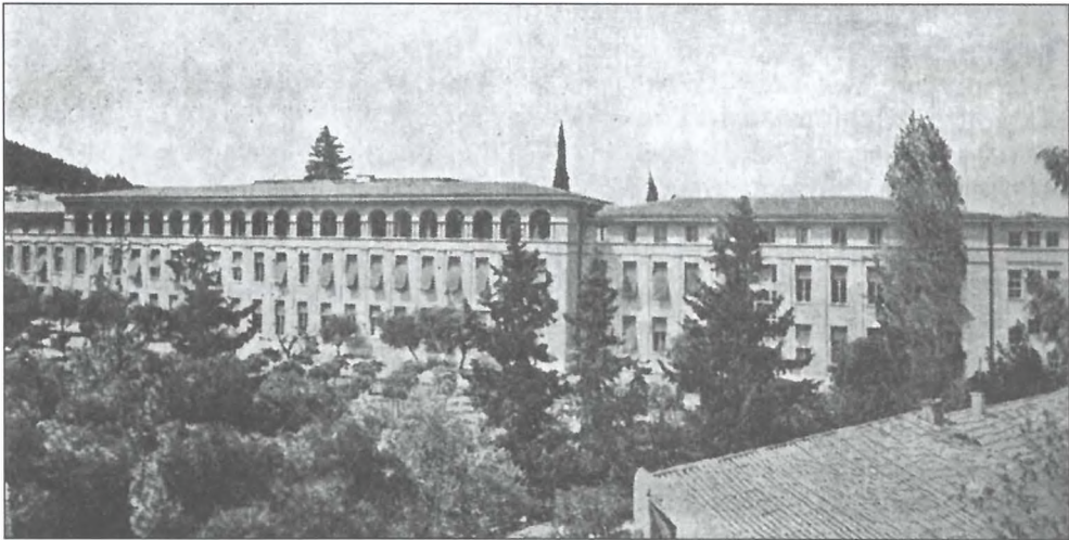
Μια άποψη του Μαιευτηρίου “ΜΑΡΙΚΑ ΗΛΙΑΔΗ” κατά την ημέρα των εγκαινίων του (16/2/1933).