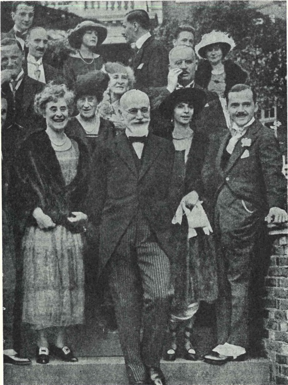
Ὁ γάμος εἰς τὸ Highgate (Σεπτέμβριος 1921).