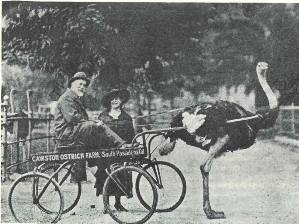
Εἰς τὴν Καλιφορνίαν (1921).

τὸ μέσον τῆς θαυμασίας αὐτῆς αἰθούσης μετὰ τις ἐπίχρυσες μπουαζερί, ὅπου κυριαρχεῖ τὸ φωτεινὸ πορτραῖτο τῆς Λαίδης Κρώσφιλδ καμωμένο ἀπὸ τὸν Λάσλο, εἶχαν στήσει ἕνα βωμόν. Τὰ ὀκτὼ παράθυρα ποὺ φωτίζουν τὴν αἶθουσαν ἀνοίγονται πρὸς μίαν ταράτσαν ποὺ δεσπόζει ἐνὸς χώρου ἐπικλινούσας, ὅπου εἶναι παρατεταγμένη μία ὀλόκληρη στρατιὰ δένδρων μετὰ ὄλους τοὺς τόνους τοῦ πρασίνου, τοὺς ὁποίους διακρίπτει ἐνίοτε ἡθερμὴ νότα μιᾶς πορφυρένιας ὀξυᾶς.