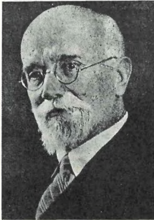
Αποσπάσματα από την αυτοβιογραφία της "Ελενας 'Ελ. Βενιζέλου «A l'ombre de Veniselos».