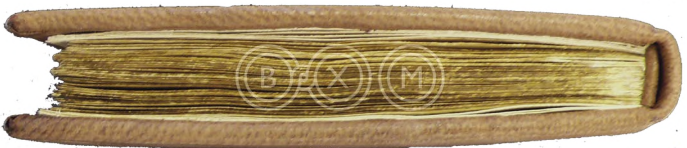
Χαρακτηριστικές φωτογραφίες των χειρογράφων πριν και μετά τη συντήρηση