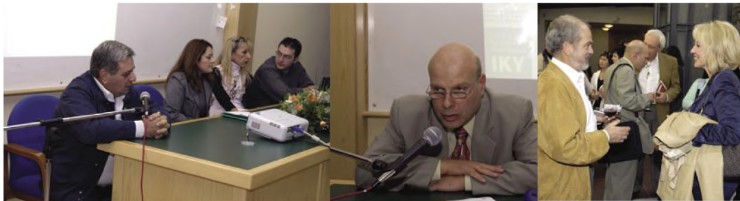
Από την εκδήλωση 20 χρόνια erasmus