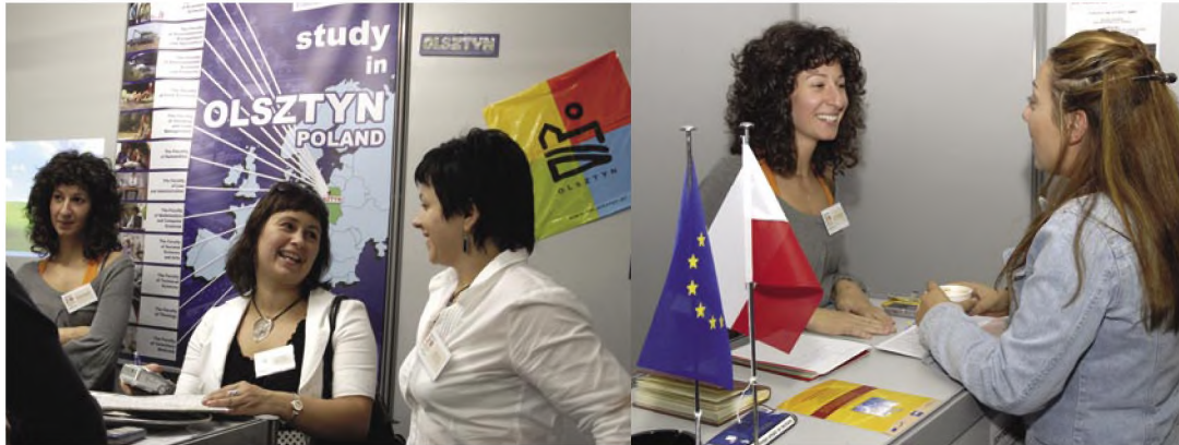
Περίπτερα στο κεντρικό διάδρομο του ΤΕΙ