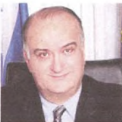
Δημήτρης Νίνος ΠΡΟΕΔΡΟΣ ΤΕΙ ΑΘΗΝΑΣ