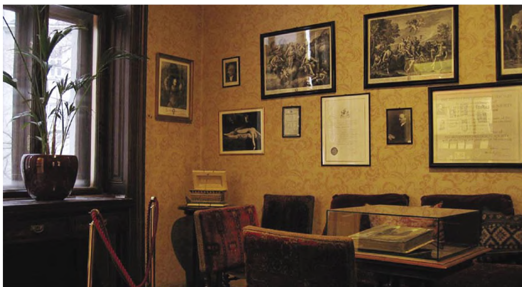
Το γραφείο του Sigmund Freud

■ Μέχρι τα 35 του χρόνια ασχολήθηκε με την νευρολογία, περιέγραψε το φαινόμενο της