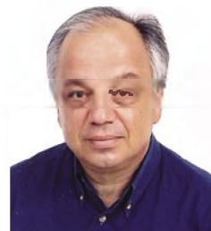
του Ε. Γ. Παπαγεωργίου*

«Πολλές από τις απόψεις του SIGMUND FREUD, φαίνεται να αντλούν την προέλευσή τους από την αρχαία ελληνική σκέψη, όπου το “γνώθι σαυτόν” αποτελεί κορυφαία επιταγή»