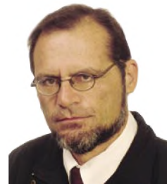
του Ι. Δ. Μπουρή*

Το Ευρωπαϊκό Πρότυπο Διαχείρισης Διδακτικών Μονάδων (ECMS)