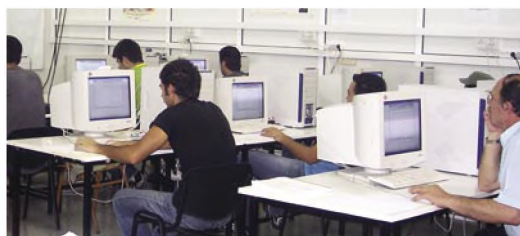
εξετάσεις φοιτητών με το ΑΣΕΑ

παίγνιο βασισμένο στη τύχη που θα «παίζεται» από τους φοιτητές. Η αρνητική βαθμολογία σε περίπτωση λανθασμένης ή ελλιπούς απάντησης είναι ένας τρόπος εξισορρόπησης αυτής της παραμέτρου. Αλληλοσυνδεόμενες ερωτήσεις και δοκιμασίες (tests) είναι ένας άλλος τρόπος. Και οι δύο τρόποι ελαχιστοποίησης του παράγοντα «τύχη» χρησιμοποιήθηκαν στο ΑΣΕΑ. Ο χρόνος που δίδεται για την εξέταση πρέπει επίσης να υπολογιστεί προσεκτικά. Πρέπει αντικειμενικά ένας «διαβασμένος» φοιτητής να μπορεί να απαντήσει το σύνολο των ερωτήσεων χωρίς ιδιαίτερο άγχος χρόνου. Κάποιος συνάδελφος που θα θελήσει να χρησιμοποιήσει ένα παρόμοιο