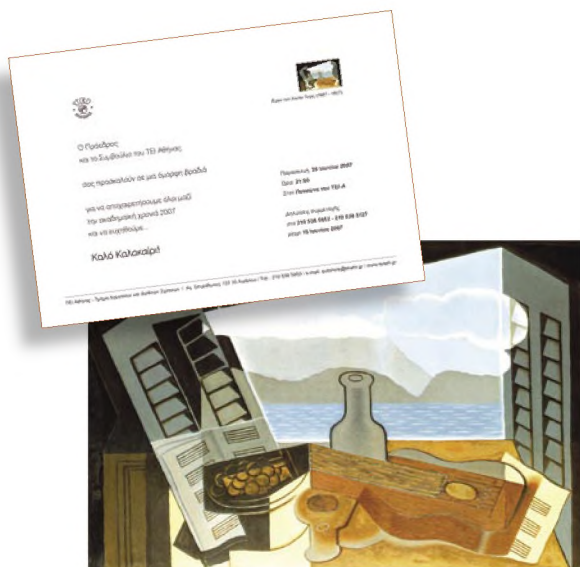
Έργο του Χουάν Γκρίς (1887 - 1927)