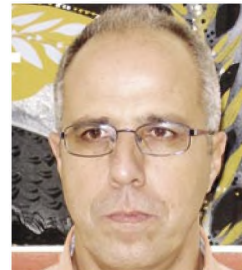
του Ν. Μ. Χιωτίνη*

Ο ι κοινωνίες υπάρχουν και εξελίσσονται στηριγμένες σε στοιχεία φανταστικά, εξίσου, αν όχι περισσότερο ως προς τις «πραγματικές» ανάγκες, κατά την τρέχουσα αντίληψη του όρου «πραγματικός», όρος σε κάθε περίπτωση δύσκολος να οριστεί. Ο Απόλλων των Δελφών, έλεγε ο νεαρός Marx, ήταν για τους Έλληνες μία δύναμη τόσο πραγματική όσο και οποιαδήποτε άλλη, η δε υποτιθέμενη «πραγματική» Οικονομία έχει καταδήλως φανταστικά θεμέλια. Αυτή η φανταστική θεμελίωση των κοινωνιών, που ο Καστοριάδης αποκαλούσε «φανταστική θέσμιση των κοινωνιών», είναι κατ' ουσίαν η φιλοσοφική θεμελίωσή τους, γιατί έχει να κάνει με τον τρόπο που ο Άνθρωπος θεωρεί την ύπαρξή του στο Χώρο και στο Χρόνο, στον Κόσμο και στην Ιστορία, απ' όπου προκύπτουν η νοηματοδότηση της ζωής και η θέσπιση υπαρξιακής ταυτότητας των ατόμων, αξιών, κανόνων και προτεραιοτήτων της καθημερινότητας.