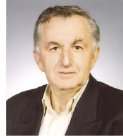
του Ν. Παταργιά*

...πληθαίνουν οι επικριτές της θεωρίας των χορδών