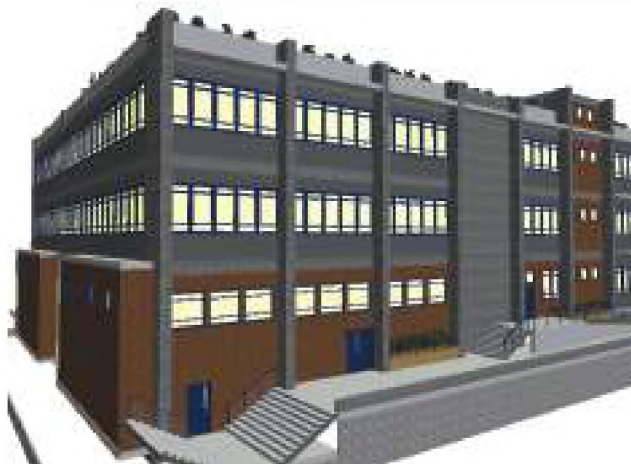
Νοτιοανατολική Αποψη - Προοπτικό κτιρίου