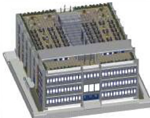
Βορειοανατολική Αποψη - Αξονομετρικό κτιρίου.

Το έργο αυτό θα κατασκευαστεί στον υπαίθριο χώρο όπου παλαιότερα στεγαζόταν το γήπεδο μπάσκετ του Τ.Ε.Ι. και θα αποτελείται από δυο μεγάλα αμφιθέατρα χωρητικότητας 300 περίπου θέσεων το ένα, δέκα αίθουσες διδασκαλίας, είκοσι γραφεία καθηγητών και ένα τριώροφο υπόγειο χώρο στάθμευσης αυτοκινήτων χωρητικότητας 400 περίπου θέσεων. Έχει ήδη ολοκληρωθεί η στατική και αρχιτεκτονική μελέτη από τον πολιτικό μηχανικό και μέλος Ε.Π. του Ιδρύματος κ. Παπάζογλου. Το έργο αυτό έχει ενταχθεί στο Πρόγραμμα Δημοσίων Επενδύσεων και θα προχωρήσει αφού εκδοθεί σχετική άδεια έπειτα από τροποποίηση του συντελεστή δόμησης.