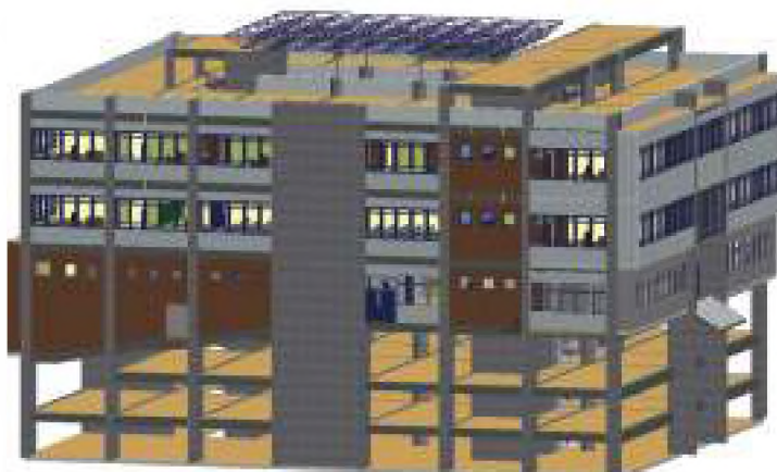
Προοπτικό κτιρίου με τους τρεις υπόγειους χώρους σταθμεύσεως.