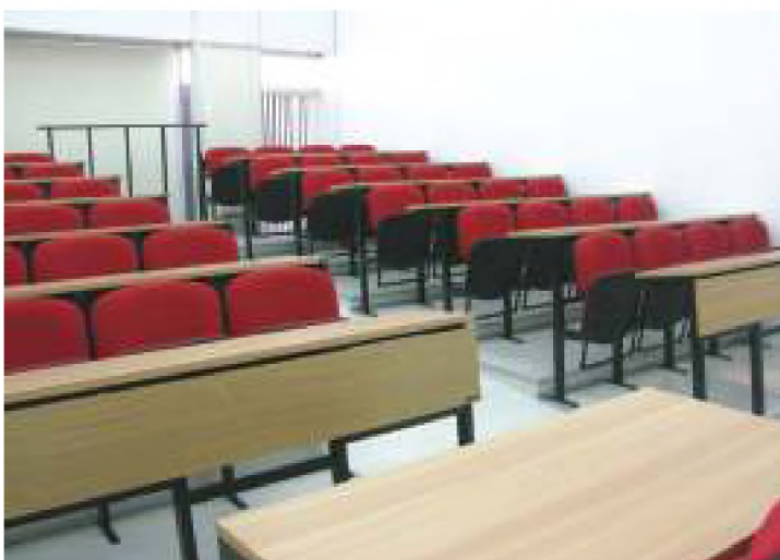
Αίθουσες μεταπτυχιακών προγραμμάτων ΣΕΥΠ