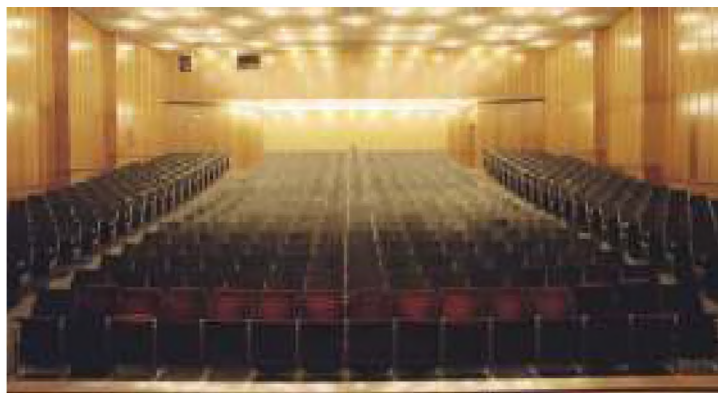
Κεντρικό αμφιθέατρο του ΤΕΙ-Α.

Το εν λόγω έργο, που επίσης χρηματοδοτείται μέσω των Δημοσίων Επενδύσεων, προέβλεπε μελέτη προϋπολογισμού 26.550 , η οποία έχει ήδη εγκριθεί από το Συμβούλιο του Τ.Ε.Ι. και ακολουθεί η εφαρμογή της προϋπολογισμού 536.000 με τη δημοπράτηση του έργου και τη διενέργεια του σχετικού διαγωνισμού την 24η Οκτωβρίου 2006.