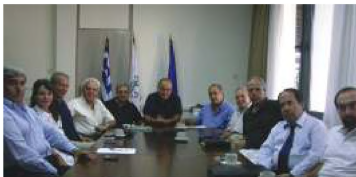
Το νέο και το απερχόμενο Συμβούλιο.