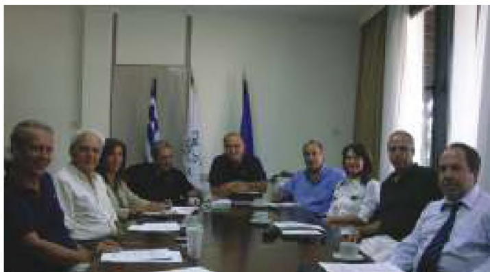
Το νέο Συμβούλιο του Τ.Ε.Ι. Αθήνας.

Το Συμβούλιο του Τ.Ε.Ι. συνεδρίασε για πρώτη φορά στις αρχές Σεπτεμβρίου, με τη νέα του σύνθεση, όπως αυτή προέκυψε έπειτα από την ανάδειξη των Διευθυντών των Σχολών.