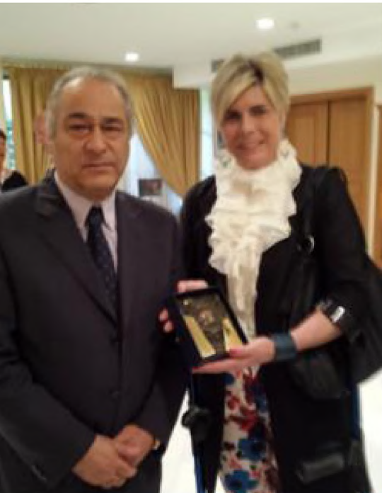
Η Πριγκίπισσα Laurentien της Ολλανδίας και ο Πρόεδρος του ΤΕΙ Αθήνας καθηγητής Μιχαήλ Μπρατάκος