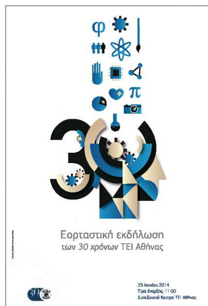
Αφίσα 30 χρόνων σχεδιασμός: Ν. Λιάκος Φ. Αβραμίδης