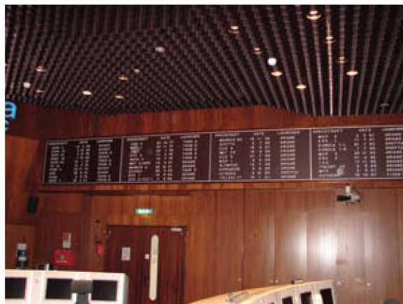
Οι πρώτες διαστημικές αποστολές της ESA.