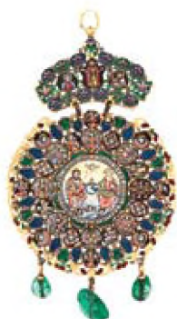
Αρχιερατικό εγκόλπιο αμφιπρόσωπο, 16 ου αιώνα