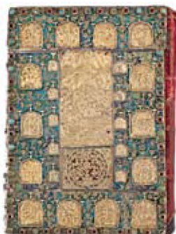
Ευαγγέλιο (1710), από τις Σαράντα Εκκλησίες (Kirkkilise)