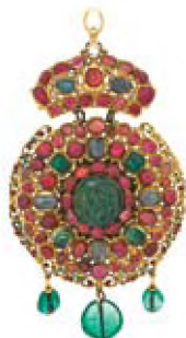
Αρχιερατικό εγκόλπιο αμφιπρόσωπο, 16 ου αιώνα