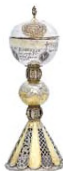
Αγιο Ποτήριο, 1729 από τη Μονή Ταξιαρχών Καππαδοκίας