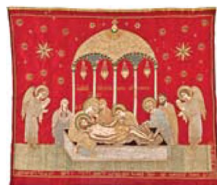
Επιτάφιος χρυσοκέντητος (1723) από την Κωνσταντινούπολη, έργο της Δεσποινέτας