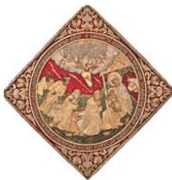
Επιγονάτιο, χρυσοκέντητο, από την Κωνσταντινούπολη (1696), έργο της Δεσποινέτας