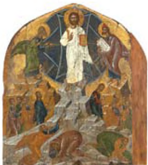
Η Μεταμόρφωσις του Σωτήρος, Φορητή εικόνα 17 ου αιώνα, από την Κωνσταντινούπολη, διαστ. 1,45 x 1,30