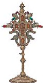
Σταυρός Αγιασμού, 18 ου αιώνα, από την Καισάρεια