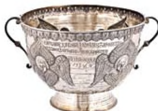
Δοχείο Αγιασμού (1722)