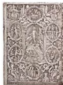
Ευαγγέλιο (1801), από τη Μονή Αγ. Ιωάννου Καισάρειας