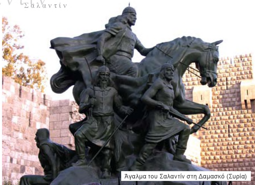
Άγαλμα του Σαλαντίν στη Δαμασκό (Συρία)

ότι αρκετοί πιστοί της δυναστείας των Φατιμιδών δεν μπορούσαν να αποδεχθούν την επικυριαρχία ενός Κούρδου Σουνίτη στα εδάφη τους.