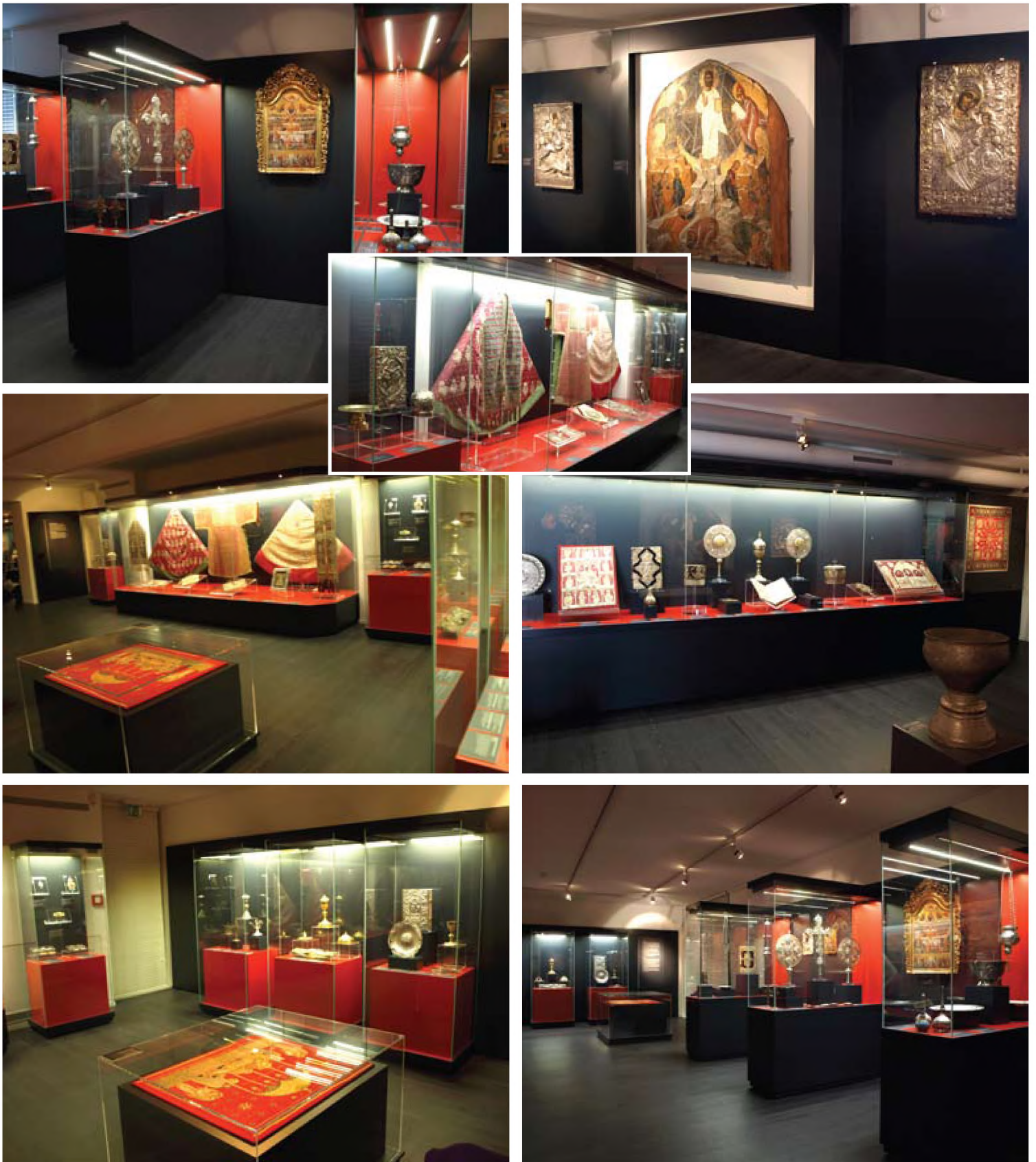
Απόψεις του μουσείου εκκλησιαστικής τέχνης στο Σαμπέζυ της Γενεύης