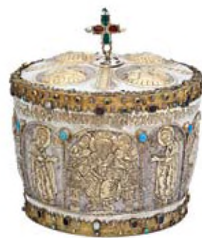
Αρχιερατική Μίτρα (1739)