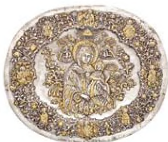
Δίσκος αργυρός - επιχρυσος (1866), από την Καλλίπολη