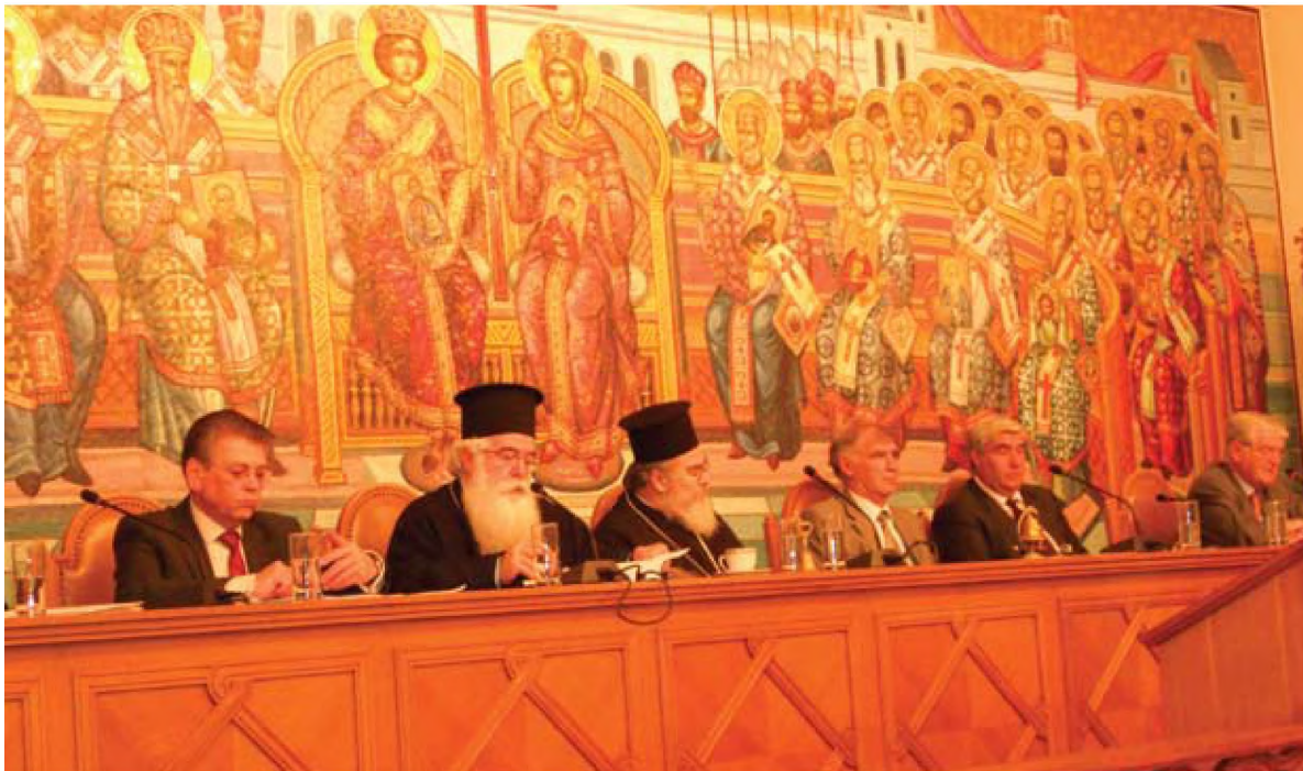
Χ. Πετρέας, Μητροπολίτης Δημητριάδος και Αλμυρού Ιγνατίου, Μητροπολίτης Ζακύνθου Χρυσόστομος, Ν. Ολυμπίου, Π. Λύτρας, Α. Δοξιάδης