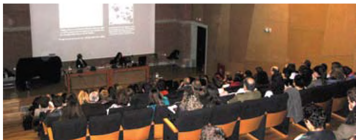
Τελευταία μέρα του Συμποσίου στο αμφιθέατρο του Βυζαντινού Μουσείου Θεσσαλονίκης