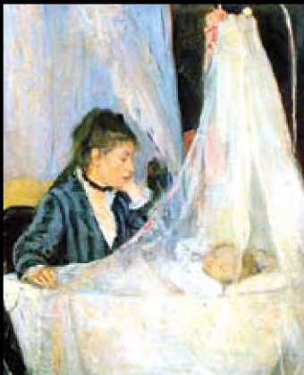
Berthe Morisot, Le berceau (The Cradle), 1872