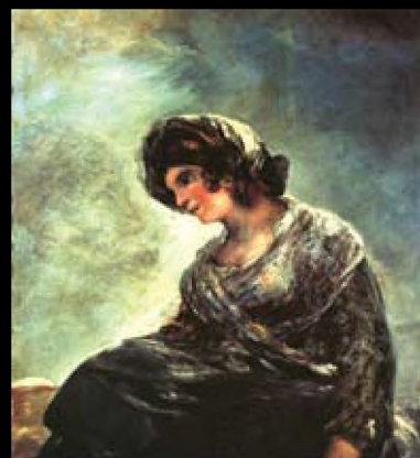
Francisco Goya, La Laitière de Bordeaux, 1827