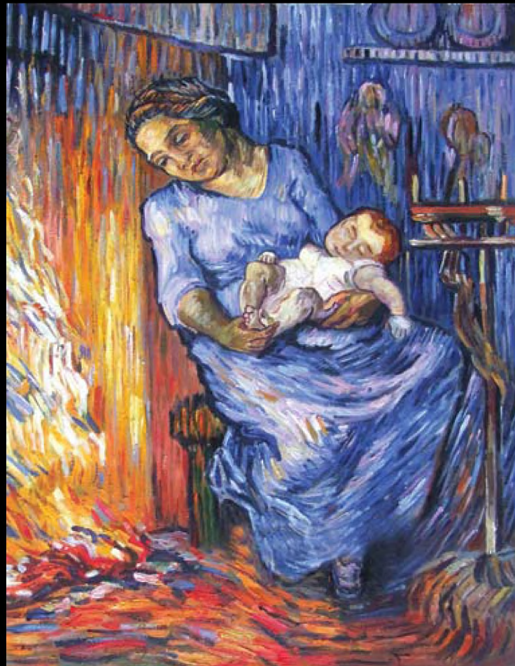
Vincent van Gogh "Man is at Sea", 1889