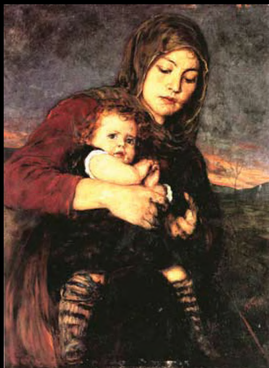
Νικόλαος Γύζης, Μητέρα και παιδί, 1883