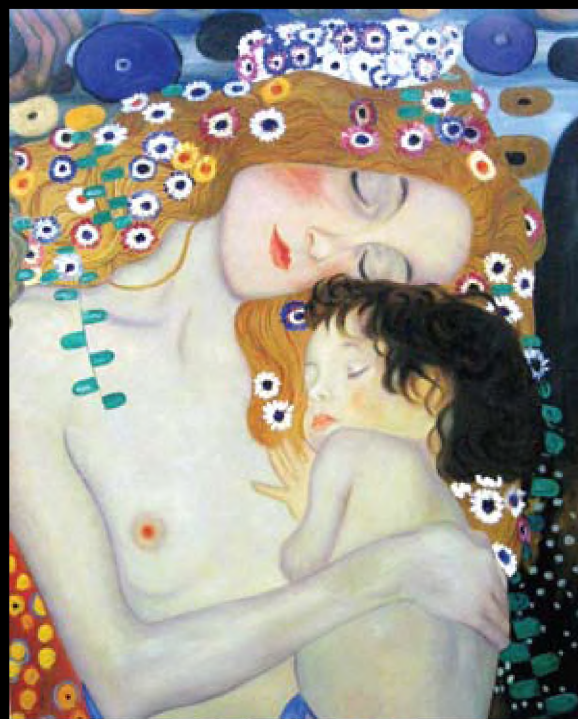
Gustav Klimt, Mother and child, 1905