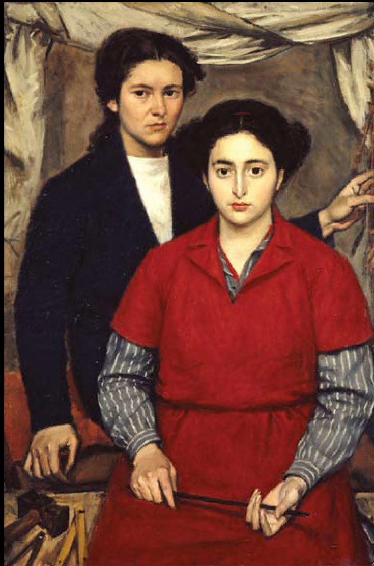
Γιάννης Μόραλης «Δύο φίλες», 1946