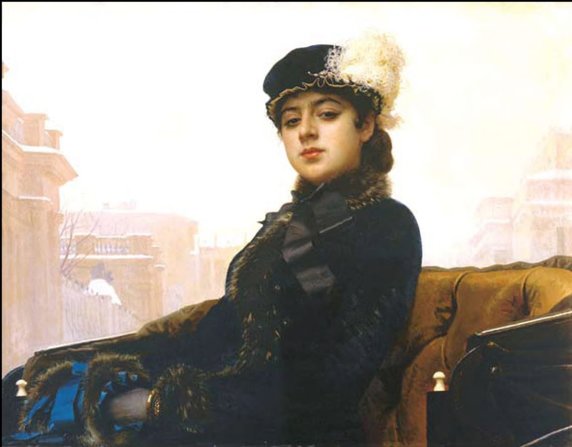
Ivan Nikolaevich Kramskoy, Portrait of a Woman, 1883