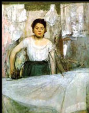
Edgar Degas, Les repasseuses (Women Ironing), 1884